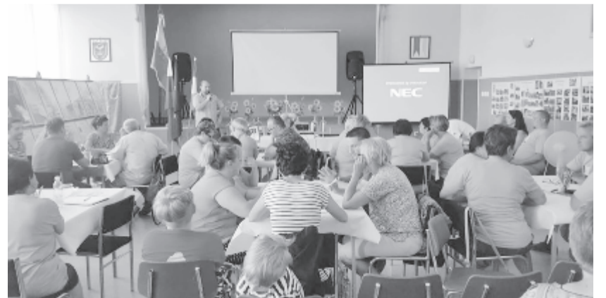
Legutóbb Szapon tartottak hasonló, európai kérdéseket érintő tanácskozást.

Am nemcsak ilyen komoly kérdések megvitatása szerepel a hét programjában, lesznek kötetlen alkalmak is, amikor minden csapat bekapcsolódhat sportrendezvényekbe, főzhetnek, táborúzt mellett szórakozhatnak, de betervezték székelyföldi kirándulást is, és jut idő Marosvásárhely és Jedd nevezetességeinek meglátogatására is. Jedd lakosait arra kéri, hogy amikor tehetik, kapcsolódjanak be a tevékenységekbe. Ugyanakkor a hét végén részt vesznek a jedd-i községi napokon és a pálinkafesztiválon is.